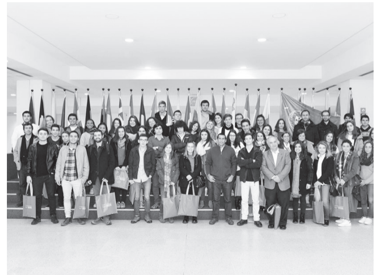
Alunos e professores portugueses com os deputados europeus

O terceiro dia foi o mais marcante. De manhã, os alunos visitaram o Parlamento Europeu, onde puderam visitar o Hemicírculo, conhecer um dos deputados do PCP, conhecer o funcionamento das várias áreas do Parlamento, havendo ainda tempo para uma troca de lembranças e para a fotografia de grupo. Durante a tarde, o grupo visitou o