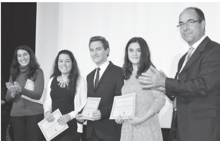
Cerimónia de entrega de prémios de mérito relativos ao ano letivo 2014-15