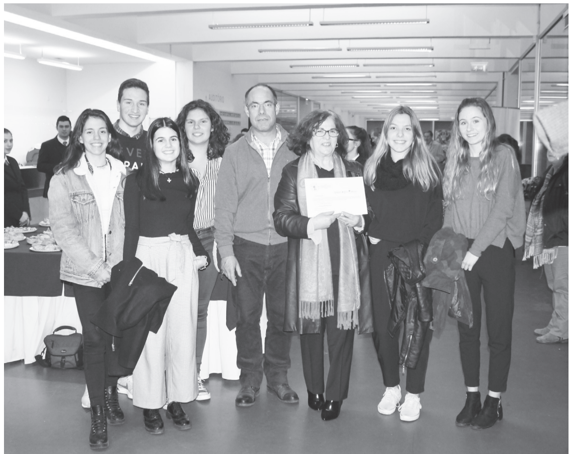
O diretor do AES e os proponentes do projeto Turistificar a paisagem de Celinda .

A FIP pretende aplicar a valorização dos seus ativos em acções que contribuam para o desenvolvimento da Ciência, da Economia, da inovação tecnológica, da difusão da Cultura Portuguesa.