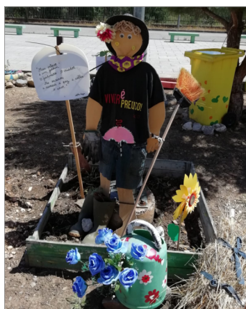
Em baixo: hortas pedagógicas.