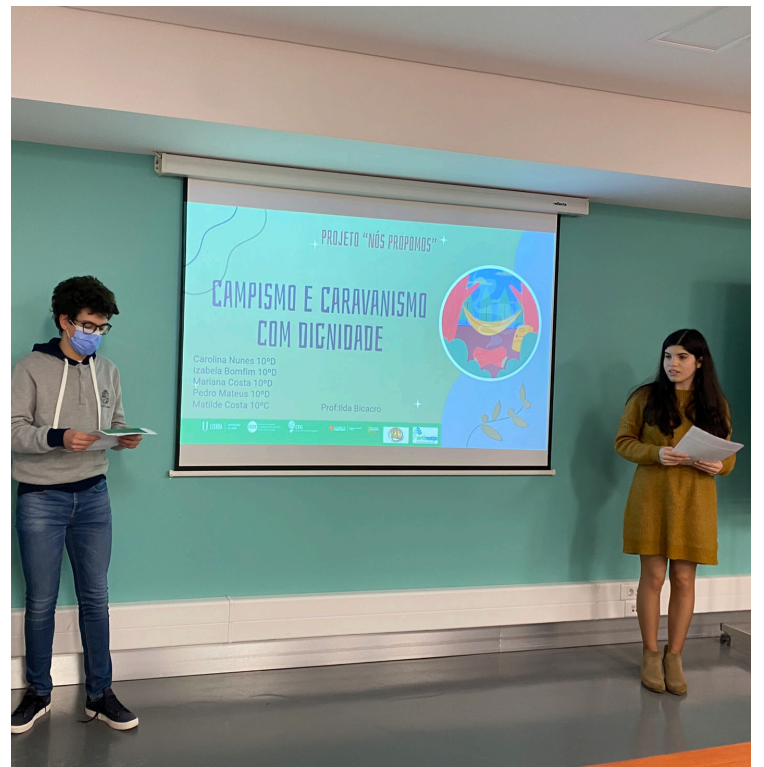
Apresentação do projeto “Campismo e caravanismo com dignidade”, no IGOT.