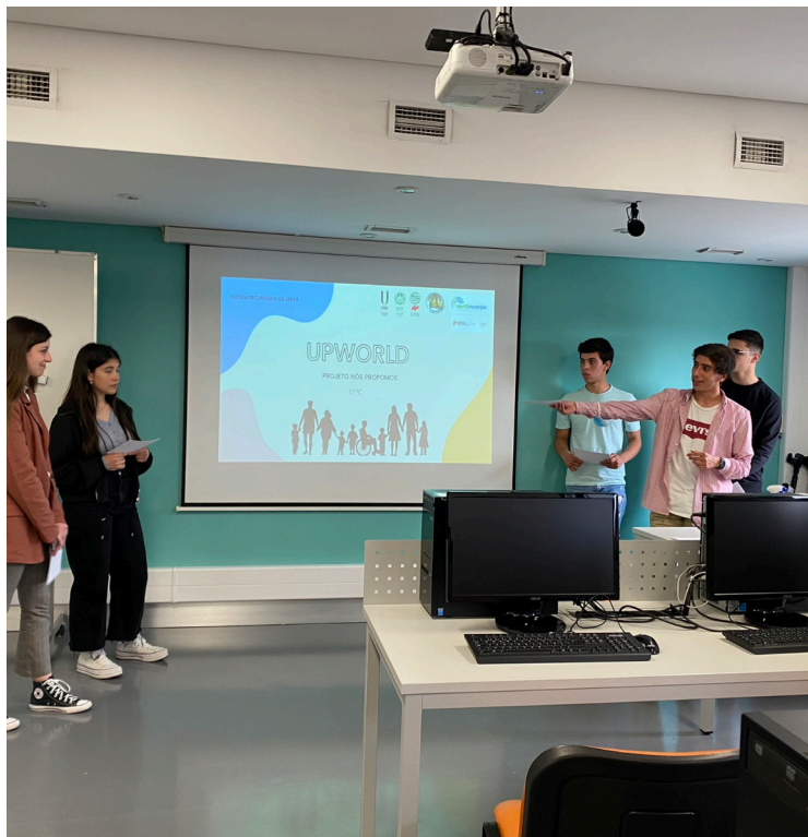
Apresentação do projeto “UP World”, no IGOT, Universidade de Lisboa.