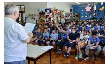
A declamação de alguns poemas.