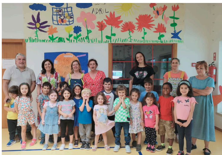
As crianças da Sala Azul do JI da Sertã.