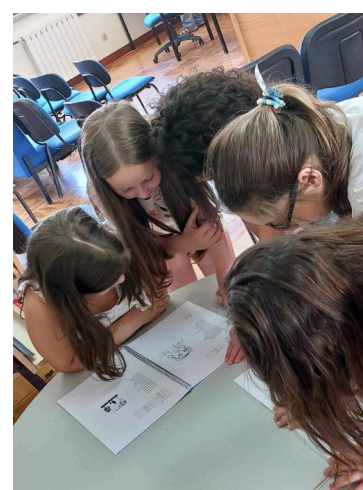
Os alunos apreciam os poemas dos colegas.