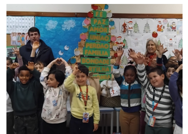
A felicidade da solidariedade.