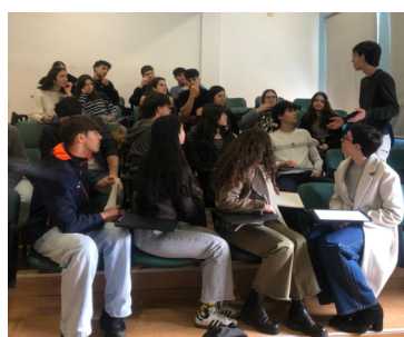
Pormenor da sessão escolar.