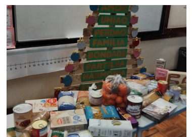
O cabaz solidário da turma 1.ºC.

dos encarregados de educação, bem como a todos os pais, o apoio e colaboração demonstrados, sem os quais a iniciativa não teria sido bem-sucedida.